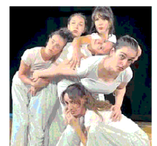
New Generation 25